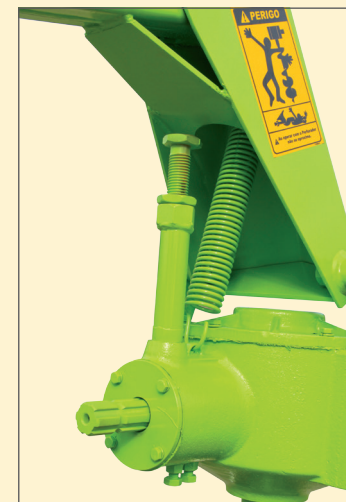
CAIXA REDTORA COM REGULAGEM PARA NIVELAMENTO