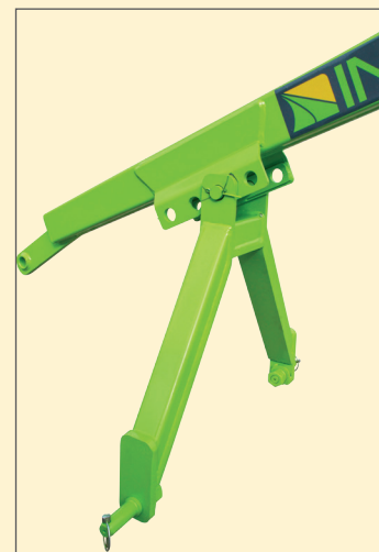
TERCEIRO PONTO COM REGULAGEM DE ALTURA